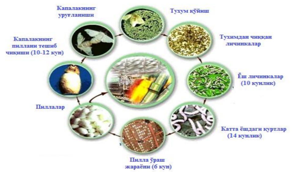
Тут ипак қурти пилласини етиштириш цикли