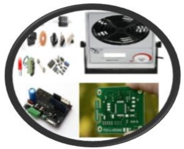
Маҳсулот олиш цикли