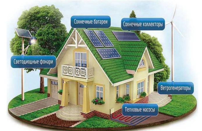
Қайта тикланувчи гибрид электр станцияси уй хўжалиги учун