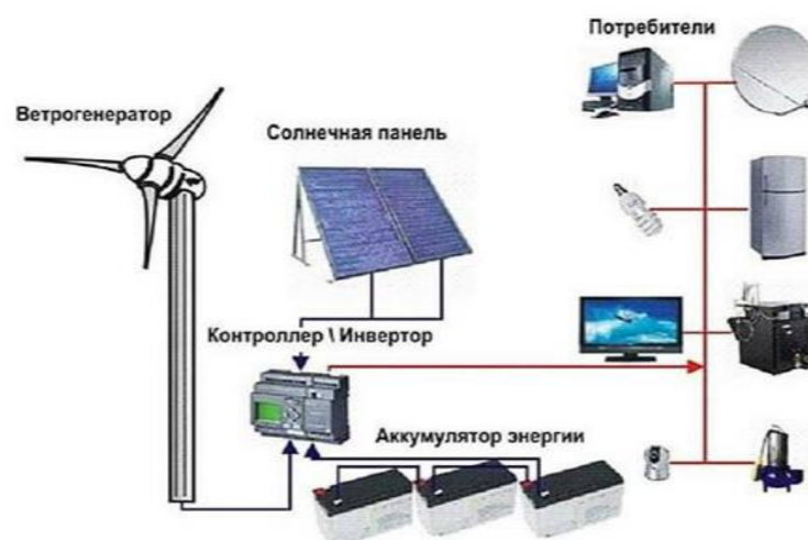
Қайта тикланувчи гибрид электр станцияси структураси