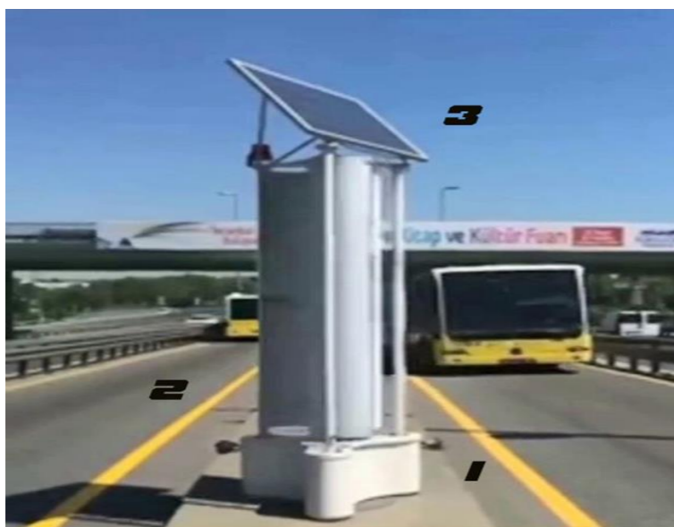
Гибрид электр станцияси