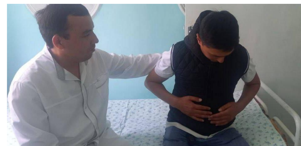
Инновацион даволаш нимчаси ёрдамида даволаш жараёни