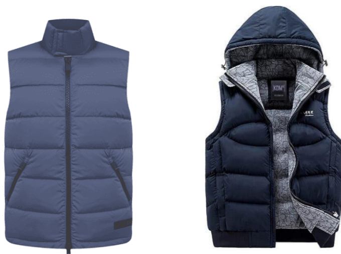
Инновацион даволаш нимчасининг кўриниши