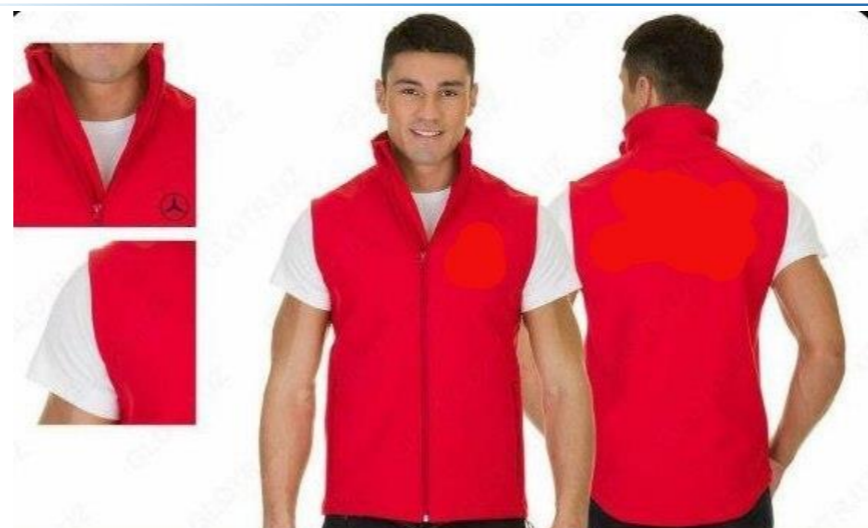
Инновацион даволаш нимчасидан фойдаланиш ҳолатлари